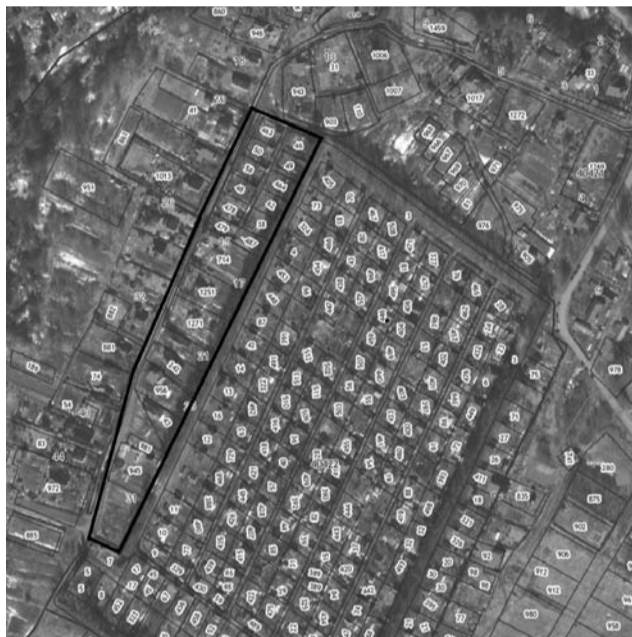
Ситуационная схема территории в границах квартала п. Красная Горка, Покровское сельское поселение, Рыбинский муниципальный район, Ярославская область